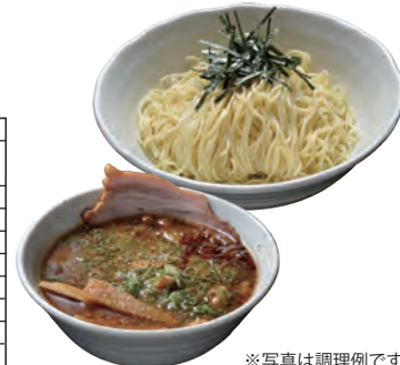
※写真は調理例です。