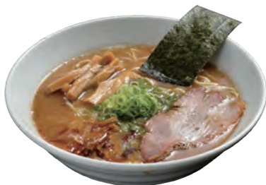
※写真は調理例です。