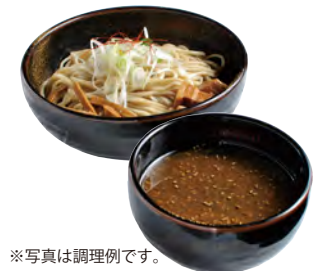
※写真は調理例です。