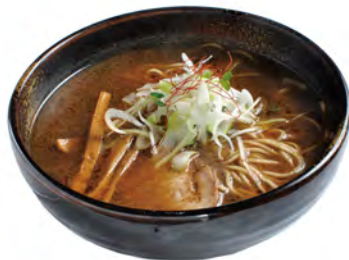
※写真は調理例です。