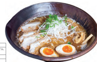
※写真は調理例です。