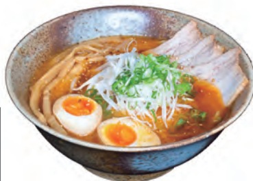
※写真は調理例です。